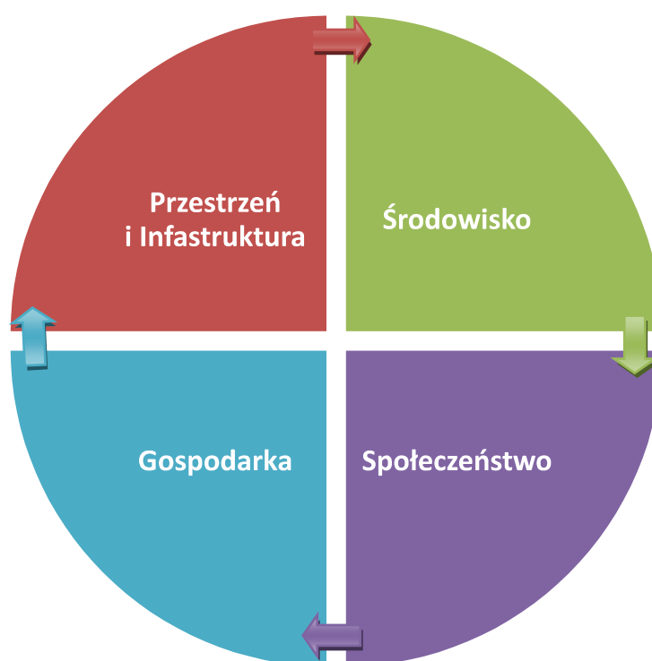
Rysunek 2. Obszary priorytetowe Strategii Rozwoju Gminy Tuczępy

Diagnoza społeczno-gospodarcza stanu obecnego Gminy Tuczępy przeprowadzona w II części strategii, wyniki przeprowadzonych konsultacji społecznych oraz sporządzona na tej podstawie analiza SWOT pozwoliły na wyznaczenie celów strategicznych, do realizacji których dążyć będzie w swoich działaniach Gmina Tuczępy, aby urzeczywistnić określoną wyżej wizję.