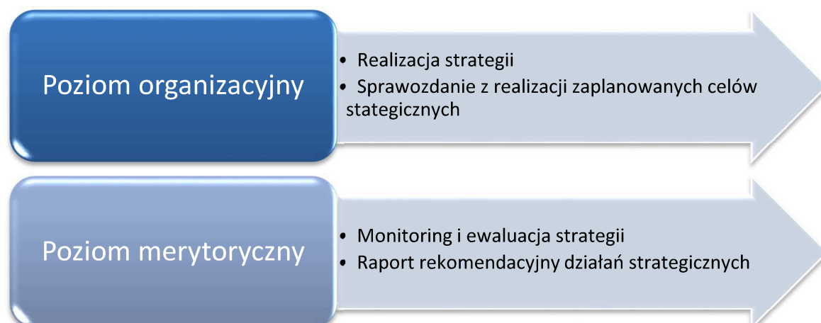
Rysunek 4. Najważniejsze poziomy wdrażania Strategii

Wdrożenie Strategii podzielone na poziomy zaprezentowane na poniższym rysunku: