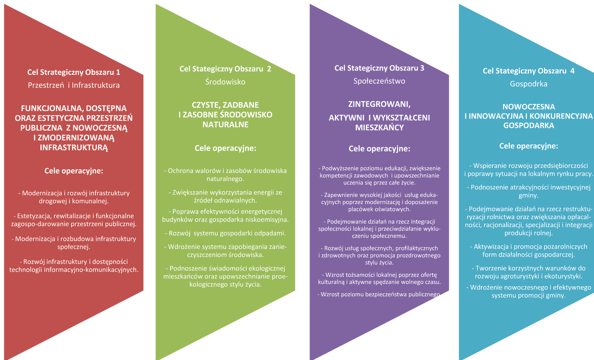
Rysunek 3. Schemat prezentujący strukturę celów strategicznych, celów operacyjnych i kierunków działań Strategii Rozwoju Gminy Tuczępy