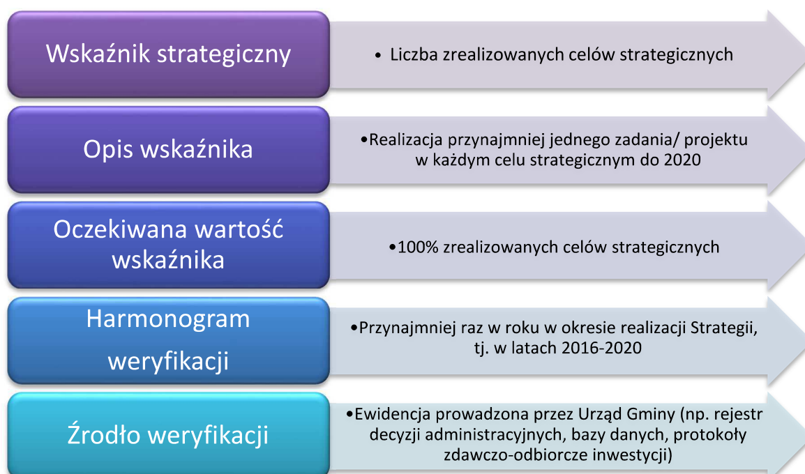
Rysunek 6. Schemat monitorowania wdrażania Strategii na poziomie strategicznym

Zapisy Strategii zostały opracowane w warunkach społecznych, ekonomicznych i politycznych, które są stanami dynamicznymi. Ewaluacja na poziomie strategicznym obejmować będzie systematyczne obserwowanie zmian wewnętrznych i zewnętrznych uwarunkowań rozwoju Gminy Tuczępy, procesów zachodzących w otoczeniu oraz aktualizowaniu celów i kierunków działania. Monitorowanie wdrażania dokumentu strategii na poziomie strategicznym przedstawia poniższa schemat: