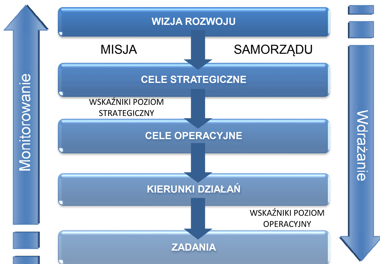
Rysunek 5. Schemat wdrażania i monitorowania Strategii na poziomie strategicznym i operacyjnym

Monitorowanie realizacji Strategii Rozwoju Gminy Tuczępy na lata 2016-2020 odbywać się będzie na poziomie strategicznym i operacyjnym.