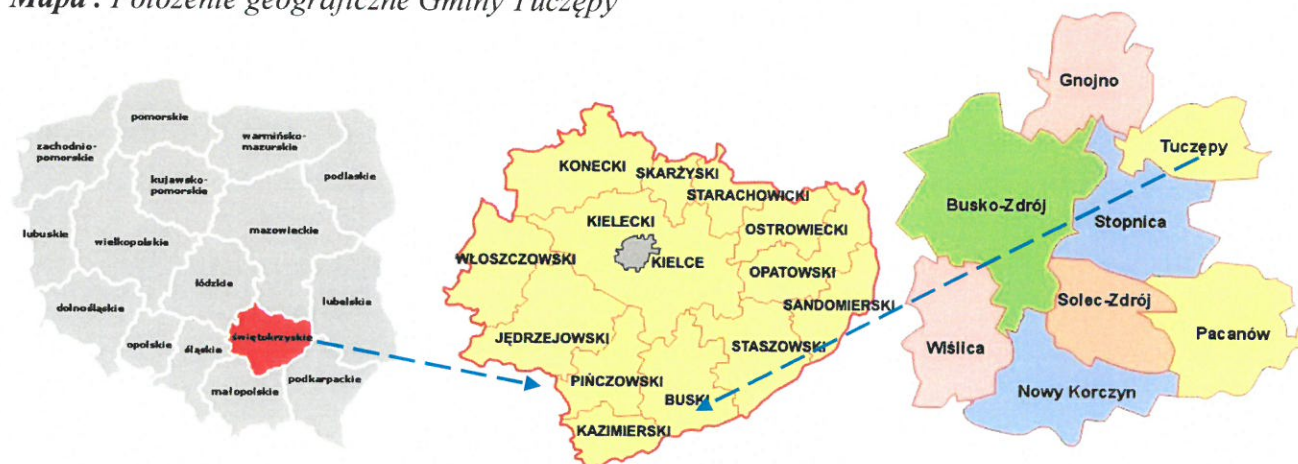
Mapa . Położenie geograficzne Gminy Tuczępy

W skład gminy wchodzi 15 sołectw. Należą do nich: Brzozówka, Chałupki, Dobrów, Góra, Grzymała, Januszkowice, Jarosławice, Kargów, Nieciesławice, Niziny, Podlesie, Rzędów, Sieczków, Tuczępy, Wierzbica.